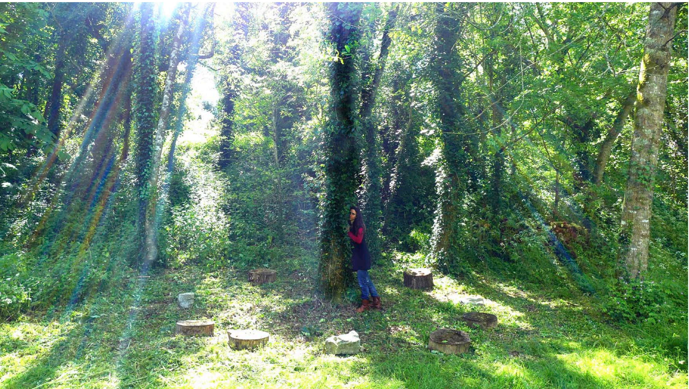
Maison de la Rivière / Communauté de communes - Montaigu-Rocheservière (Fr)