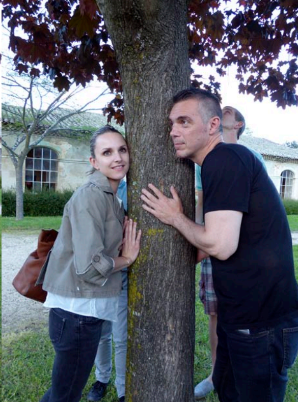
Site des Renaudières / Carquefou (Fr)