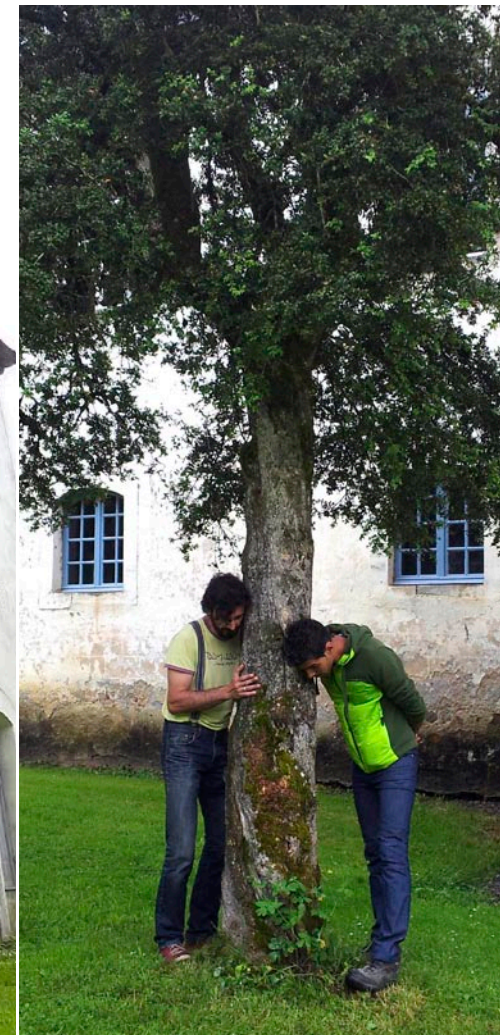
Abbaye de l'Escaladieu / «Arbres, regards d'artistes» - Bonnemazon (Fr)