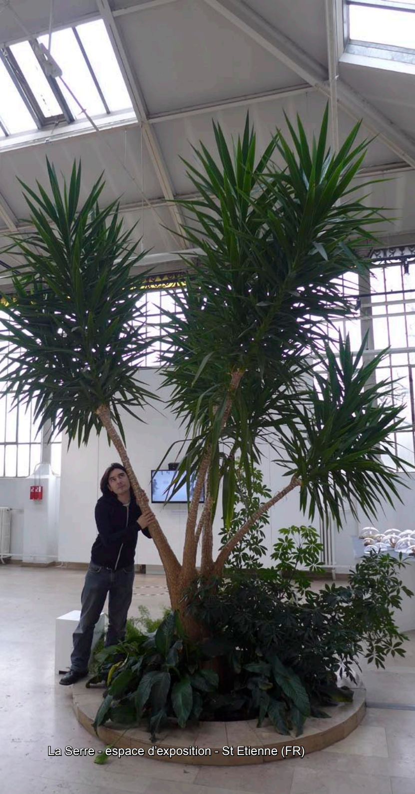
La Serre - espace d'exposition - St Etienne (FR)